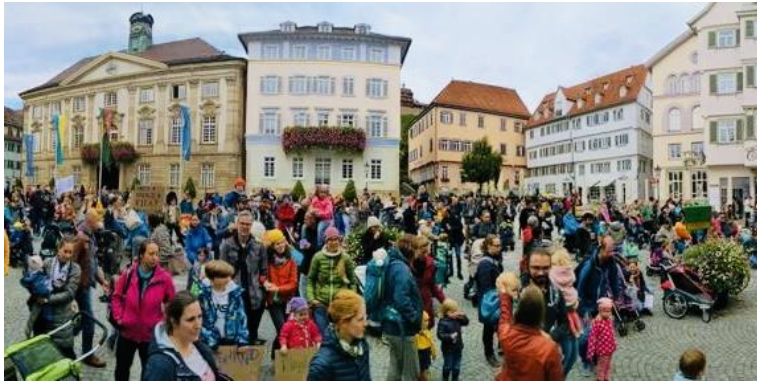
Demo am 28.9.2022